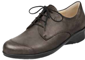
Bequemschuh von FinnComfort

Lassen Sie sich im T2 in Gelnhausen beraten!