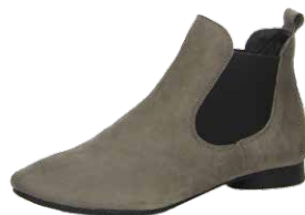
Bequemschuh von Think