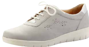
Bequemschuh von Solidus