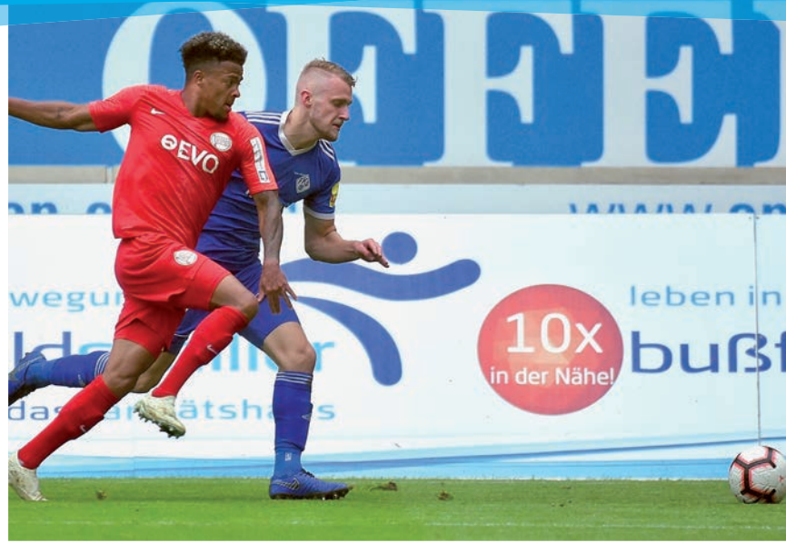
Bußfeld & Schiller, Partner der Offenbacher Kickers