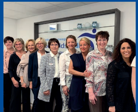
Ladies Only in der Hanauer Nordstraße