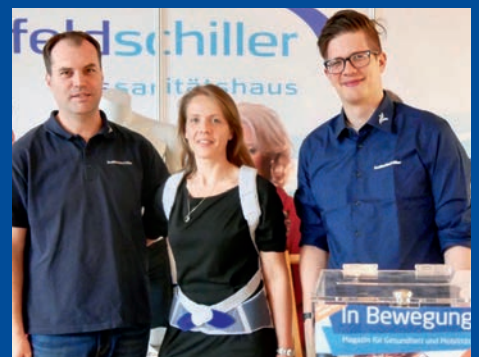
Gesundheitsmesse in Hanau

Am 13. und 14. April fand die diesjährige 7. Gesundheitsmesse im CPH Congress Park in Hanau statt. Wir waren natürlich auch wieder mit einem großen Stand vertreten. Im Fokus stand das Thema „Mobilität“. Neben verschiedenen Aktionen und Fußdruckmessungen durfte ein großes Gewinnspiel nicht fehlen. Zudem konnten sich die Besucher von unseren Experten exklusiv beraten lassen. Wir freuen uns schon jetzt auf die nächste Messe 2020!