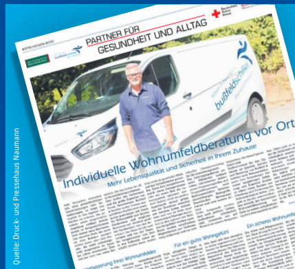
Partner für Gesundheit KW36 – 19

Im März fand die diesjährige Ladies Only Veranstaltung für unsere Kundinnen in den Räumen in Hanau in der Nordstraße statt. Neben einer Modenschau standen unsere Fachberaterinnen für die Kunden in außergewöhnlicher Atmosphäre bereit. Neben einem exklusiven Catering und kalten Getränken erhielten sämtliche Kundinnen am Ende eine vollgepackte Goodie-Tüte. Wir sagen Danke für ein fantastisches Event in Zusammenarbeit mit Amoena und Anita.