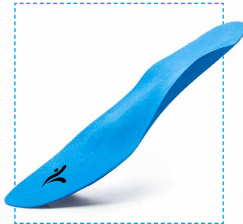
CAD-Prime Slim Line Damenmodell

Moderne Einlagen sind wahre Alleskönner in Sachen Passform und Wirksamkeit. Sie geben Halt, stützen und unterstützen den Gang und werden für jeden Fuß und jede Tätigkeit maßgenau hergestellt. Mit unserer neuen CAD-Fertigungstechnik sind wir in der Lage, noch genauer entsprechend der vorherigen umfassenden Analyse die Fußbettung auf persönliche Bedürfnisse anzupassen. Die Palette reicht von der dünnen Damenschuheinlage bis hin zur Spezialeinlage für besondere Ansprüche.