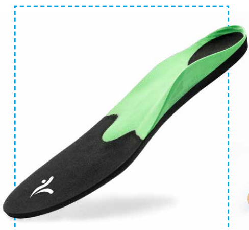
CAD-Prime Sports unisex