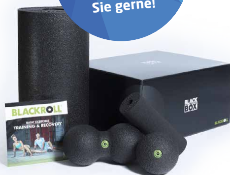
Bei Bußfeld & Schiller erhalten Sie z. B. die Blackroll® Blackbox - das Gesamtpaket für Entspannung und Leistungsfähigkeit. Ideal als Geschenk für Jung und Alt!

Ideal zum Verschenken! Wir beraten Sie gerne!