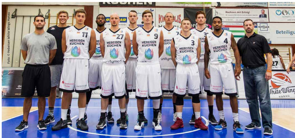
Das Team der Hebeisen White Wings Hanau. Bußfeld & Schiller stattet die Mannschaft aus mit individuellen Einlagen, Sportschuhen, Sportkompressionsstrümpfen und vielem mehr.

um den Spieler schnellstmöglich wieder zurück aufs Spielfeld zu bekommen. Wir stehen im ständigen Austausch mit den Spielern, dem Trainer, Manager, Vereinsarzt und betreuenden Physiotherapeuten, um gemeinsam