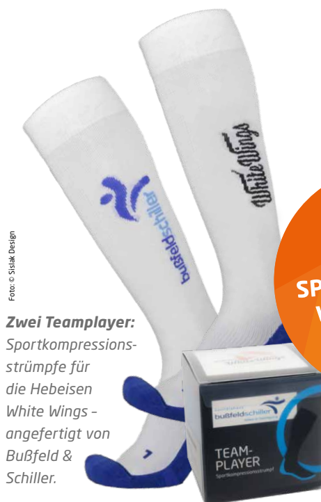
Zwei Teamplayer: Sportkompressionsstrümpfe für die Hebeisen White Wings - angefertigt von Bußfeld & Schiller.

SH: Gemeinsam mit den Vereinen und jedem Sportler möchten wir diese Zusammenarbeit weiter intensivieren, unser bestehendes Netzwerk mit unseren Partnern, Ärzten, Physiotherapeuten weiter ausbauen und kontinuierlich an Verbesserungen arbeiten. Wenn dann am Ende der Sportler mit einem Lächeln sein Ziel erreicht und wir einen Beitrag zum sportlichen Erfolg leisten konnten, ist das die schönste Art der Anerkennung unserer Arbeit.