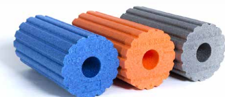
Die Blackroll® ist in verschiedenen Farben und Oberflächenstrukturen erhältlich.

Massagerollen für das Bindegewebe - jetzt bei Bußfeld & Schiller.