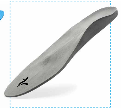
CAD-Prime Business Herrenmodell